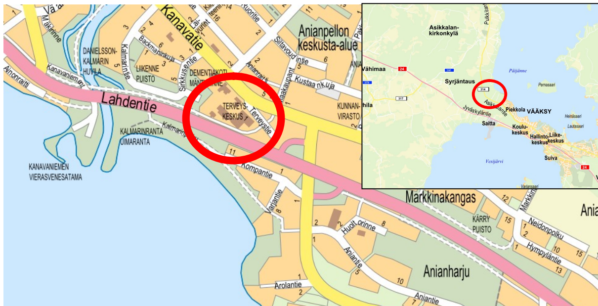
Kuva 1. Alueen sijainti opaskartassa.

Alue rajautuu etelässä Lahdentiehen (vt 24), idässä Kartanotiehen ja sen jatkeena olevaan kevyen liikenteen väylään, pohjoisessa Anianpellontiehen ja lännessä Jalmarin ravintolaan ja Mikkolan kartanon kiinteistöön RN:o 6-667. Suunnittelualueen maasto nousee loivasti kohti Lahdentietä. Alue on kauttaaltaan koneellisesti muokattua maata, jolta puusto on raivattu.