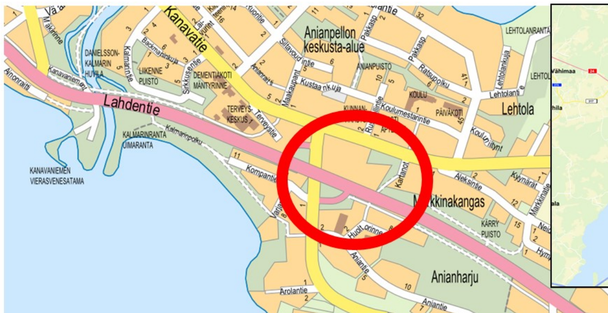
Kuva 1. Alueen sijainti opaskartassa.

Alue rajautuu etelässä Lahdentiehen (vt 24), idässä Kartanotiehen ja sen jatkeena olevaan kevyen liikenteen väylään, pohjoisessa Anianpellontiehen ja lännessä Jalmarin ravintolaan ja Mikkolan kartanon kiinteistöön RN:o 6-667. Suunnittelualueen maasto nousee loivasti kohti Lahdentietä. Alue on kauttaaltaan koneellisesti muokattua maata, jolta puusto on raivattu.