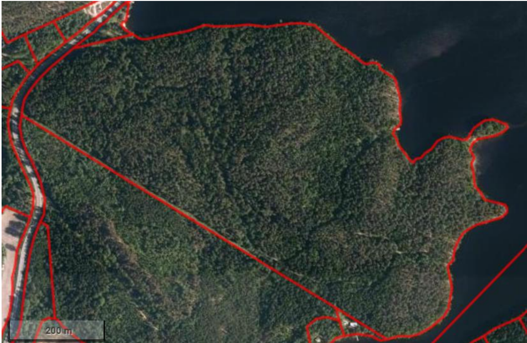
Ilmakuva on otettu n. vuonna 2016. Kuvioiden 2, 7 ja 9 harvennuksia ei ollut vielä tehty, ei myöskään naapurikuvion avohakkuuta kuvion 7 vieressä. Vertaa karttaan edellisellä sivulla.