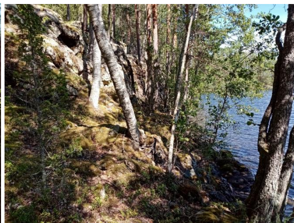
Kuva 6. Kuvion 6 jyrkkää rantaa.

Kuvio 6. Varttunutta väljää männikköä, sekapuuna kuusta ja runsaasti koivua. Kasvillisuus vaihtelee kuivasta tuoreeseen kankaaseen, lajialueella esiintyy kalliometsääkin (Kuva 6). Kuviolle on rakennettu leirikeskuksen grillikatos.