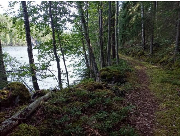
Kuva 7. Rantapolku kuviolla 1b-2.

Kuvio 11. Lähes sinivuokkotyyppiä (HeOT) edustava lehto, joka jatkuu naapuritilan puolelle ja liittyy tien pohjoispuolella LTA-rajaukseen. Kuviolla kasvaa varttunutta kuusivaltaista metsää, sekapuuna haapaa, koivua sekä kookasta raitaa, harmaaleppää ja pihlajaa. Aluspuustossa kasvaa runsaasti tuomea sekä hiukan lehmusta ja vaahteraa, pensaskerrossa lehtokuusamaa, taikinamarjaa ja pohjanpunaherukkaa. Kasvistoon kuuluvat mm. näsiä, koiranheisi, sinivuokko, kevätlinnunherne, mustakonnanmarja, mäkilehtoluste, metsävirna ja tesma. Kuvio on yleisilmeeltään luonnontilaisen kaltainen.