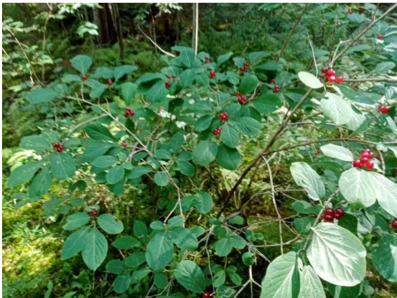
Kuva 3. Kuviolla 1b kasvaa runsaasti lehtopensaaita, erityisesti lehtokuusamaa.