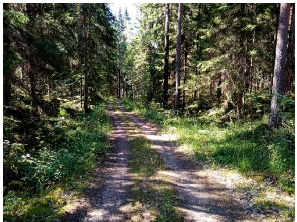
Kuva 4. Metsätie kuvion 3 itäosassa.

Kuvio 2. Harvennettua nuorehkoa kuusivaltaista metsää, jossa sekapuuna esiintyy mäntyä, koivua ja hiukan haapaa. Kasvillisuus vaihtelee tuoreesta lehtomaiseen kankaaseen ja muuttuu osakuviolla 2b lehdoksi. Metsälehmusta kuviolla kasvaa vain niukasti, lähinnä keskirinteiden muinaisrannan yläpuolella (Vrt. LTA-rajausten sijainti). Kuvion ranta on pääosin moreenipohjainen ja melko vähäkivinen.