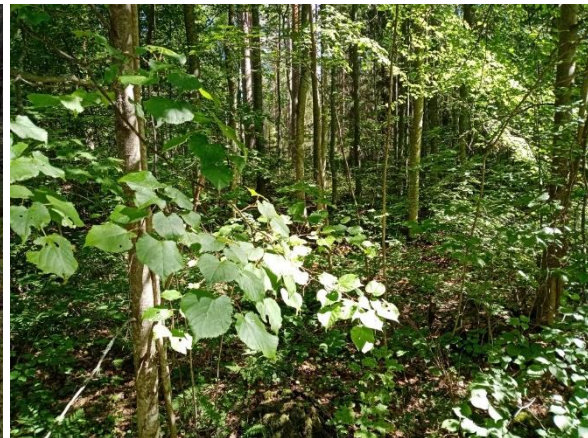
Kuva 8. Metsälehmusta kuviolla LTA2.

Kuvio 12. Nuorta haapa- ja koivuvaltaista metsää, sekapuuna mäntyä ja harmaaleppää, alikasvoksena pihlajaa ja kuusta. Kasvillisuudeltaan kuvio on tuoretta kangasta.