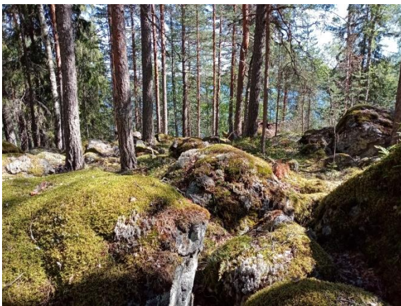
Kuva 5. Louhikkoinen mäenlaki (Kuvio 5)

Kuviot 5(-5b-5c). Varttunutta ja osin luonnontilaisen kaltaista mäntyvaltaista metsää, sekapuunapaikoin runsaasti koivua sekä kuusta ja paikoin haapaa. Mäntykeloja ja maapuita esiintyy harvakseltaan. Kivinen ja osin louhikkoinen (Kuva 5) alue on kasvillisuudeltaan kuivahkoa ja tuoretta kangasta. Kuvion ranta on louhikkoinen. Alakuviolla 5b puusto on harvennettu puistomaisesti. Alakuvion 5c niemeen ja sinne vievän polun varteen on sijoitettu leirikeskuksen rakenteita: telttapohjia, laavu ja nuotiopaikka.