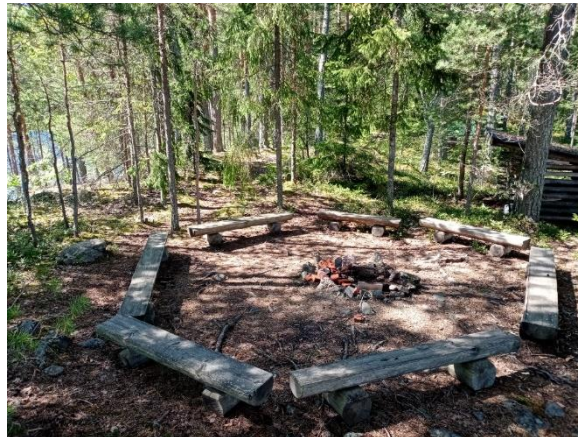
Kuva 2. Nuotiopaikka ja katos kuviolla 5c.