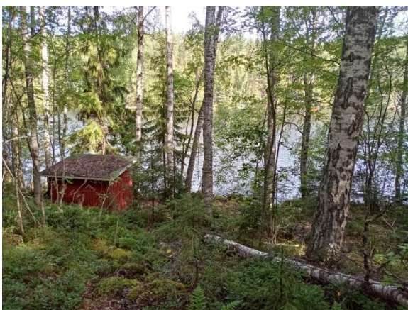
Kuva 1. Käytöstä poistettu sauna kuviolla 1.

Kuvio 1(-1b). Varttunutta kuusivaltaista metsää, jossa sekapuuna kasvaa runsaasti koivua (Kuva 1) ja mäntyä, paikoin myös haapaa ja yksittäisiä isoja raitoja sekä harmaaleppiä. Kuusi, pihlaja ja rehevillä paikoilla tuomi muodostavat alikasvoksia. Lehtilahopuuta (koivua, harmaaleppiä) esiintyy paikoin. Kasvillisuus edustaa lehtomaisia ja tuoreita kankaista. Rehevimmissä osissa lehtopensaat lehtokuusama ja taikinamarja muodostavat pensaskerrostoa. Kuviolla kasvaa myös hieman tuomea, metsälehmusta ja vaahteraa. Muusta lajistosta mainittakoon näsiä, punaherukka, sinivuokko, mustakonnanmarja, sudenmarjasinivuokko, kevätlinnunherne, mäkilehtoluste ja tesma. Osakuviolla 1b (Kuva 3), kuvion 2 luona, LTA1 ja 2 -rajausten tuntumassa sekä paikoin keskirinteessä kasvillisuus vaihtuu lehdoksi (MeLaT-VRT-OMaT). Rantaviiva on moreenipohjainen ja pääosin vähäkivinen.