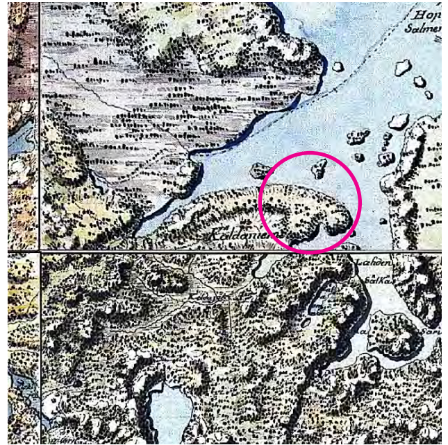
Vasen: ote Pitäjänkartasta. Oikea: Ote Kuninkaan kartastosta