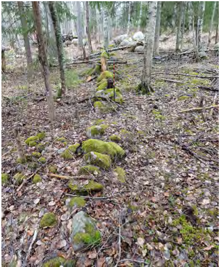
Oikealla kuva muurinjäänteistä, kuvattu etelästä pohjoiseen. Alempi kuva raivausröykkiöstä, kuvattu idästä. Kairan takana näky myös muurirakenne.