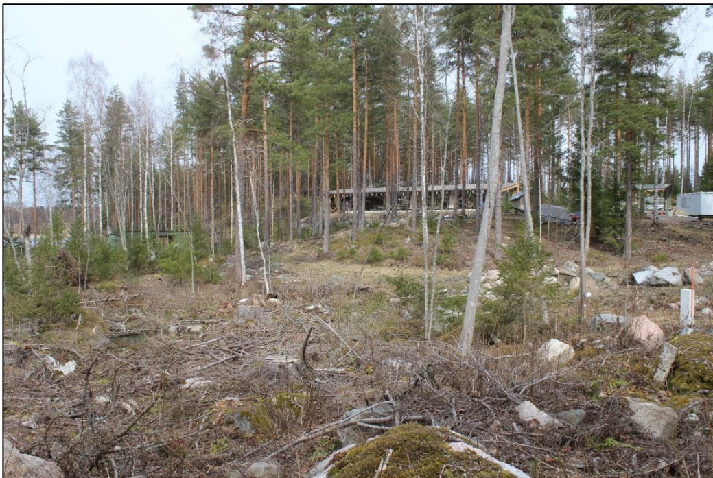
Kaavoitusalueen RA1 kuvan rakennuksen kohdalla. Kuvattu koilliseen.