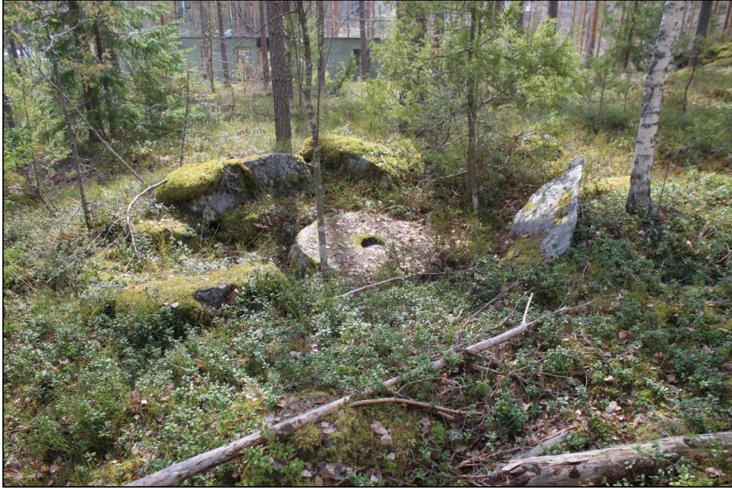
Myllynkivi. Koordinaatit: N 6784218 E 425153.