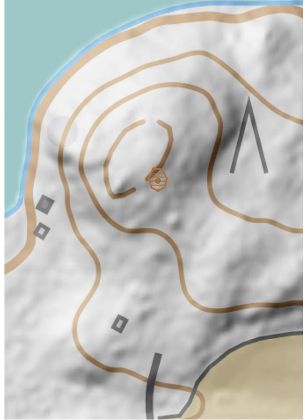
Vasen: kaavoitusalue. Oikea: muu kulttuuriperintökohde rajattu oranssilla.