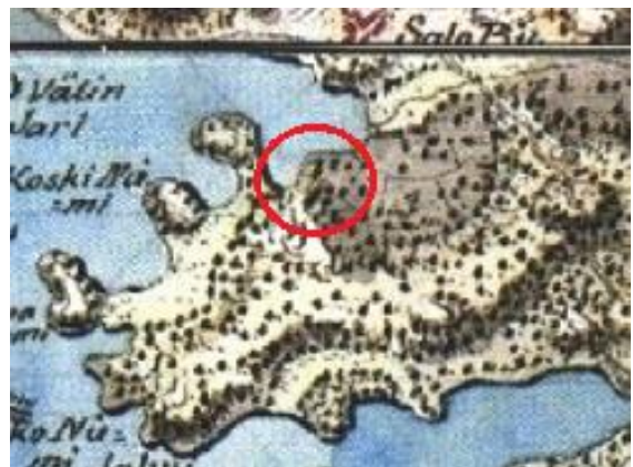
Vasen: ote vuoden 1842 Asikkalan pitäjänkartastosta. Oikea: ote vuoden 1776–1805 kuninkaankartastosta. Suunnittelu- alue punaisen ympyrän sisällä.