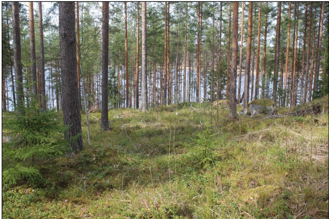
RA2 aluetta mäen päällä, kuvattu pohjoiseen.