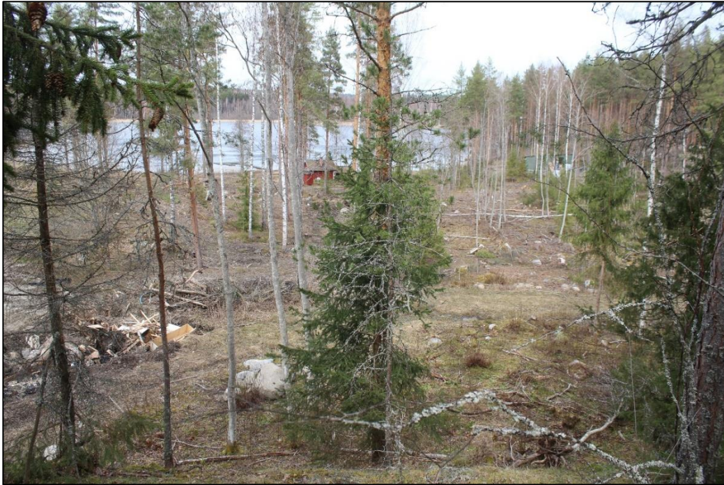
Kaavoitusalueen länsireuna, kuvattu pohjoiseen.