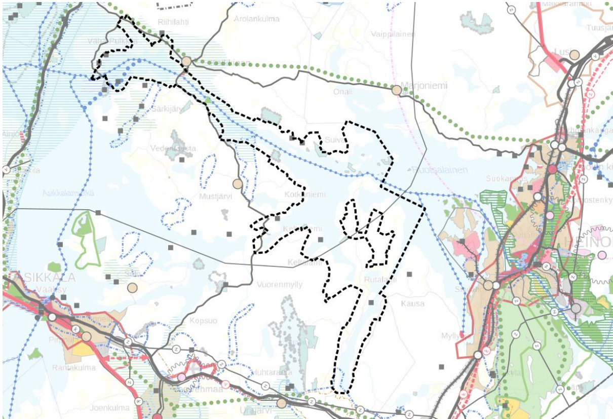
Kuva 2. Ote Päijät-Hämeen maakuntakaavasta 2014.

Alueelle on osoitettu maakuntakaavassa seuraavia merkintöjä: